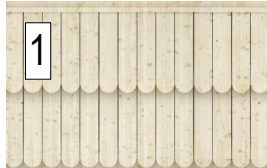
1 bardage bois naturel en planches bords à bords. mélèze