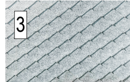
3 toiture en losange 44x44cm en zinc (panachage grisé)