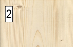
2 structure en épicea