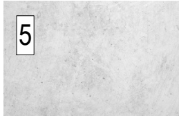
5 béton brut